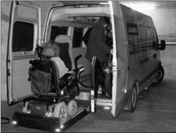
Le nouveau bus

Au mois de mars, nous avons accueilli une artiste peintre japonaise et cela a permis de faire un échange avec nos amis japonais, venus très nombreux au vernissage. Enfin, le nouveau bus est arrivé... et nous avons pu tester la climatisation au mois de juillet lors des traditionnelles sorties d'été, lorsque les ateliers sont fermés. Activités qui rencontrent un succès fou.