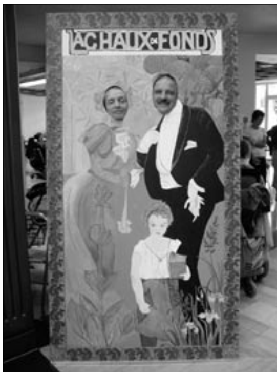
Le panneau «Art nouveau»

Le premier au niveau communal. La ville de La Chaux-de-Fonds a mis sur pieds de nombreuses manifestations sur le thème de l'Art nouveau. L'atelier créativité s'est inspiré de ce thème tout au long de l'année pour la création de différents objets, notamment d'un panneau permettant de réaliser un photomontage grandeur nature. Une visite en ville autour de ce thème a été organisée avec la collaboration d'élèves du Centre Pierre Coullery.