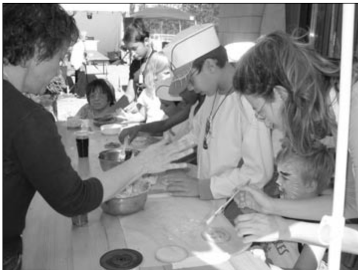
L'atelier cuisine à la fête de quartier

Et pour terminer sur l'événement suisse, les portes ouvertes du 30 septembre. Une belle occasion de présenter nos activités au grand public, de tisser des liens avec les familles, les amis et toutes les personnes intéressées à notre mission auprès de la population accueillie à Foyer Handicap.